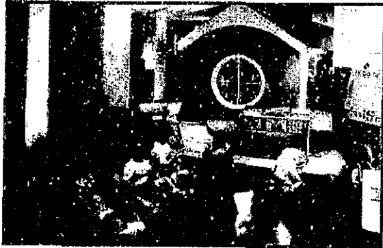
صورة توضح تواجد فراغات داخلية (في غرفة سيرس ستريت بالولايات المتحدة الأمريكية) بها أشكال ألعاب غير تقليدية كمنزل صغير أو غير ذلك

- تصميم قاعات ألعاب داخلية وخارجية تساهم أو تؤثر في مقدرة الطفل على التخيل والإبتكار، وأما أشكال الألعاب فنكون غير تقليدية وندمج في أشكال مختلفة وواقعية كمنزل صغير مثلا أو كسفينة فضاء أو غير ذلك كما في روضة سيرس ستريت "Spruce Street Kindergarten"